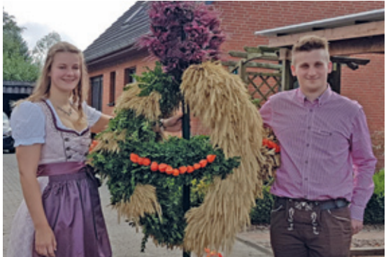
Hohener Erntefestpaar 2019.

Wir würden uns über (geliehene) Erntegaben sowie Blumen für die Dekoration sehr freuen und herzlich willkommen sind alle helfenden Hände, die uns unterstützen möchten.