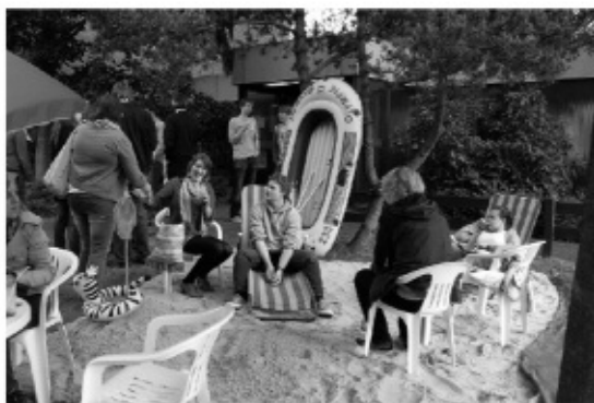
- fast wie im Urlaub : mit lecker Cocktails aus der Strandbar -

Nach dem erfolgreichem Startwochenende auf Spiekeroog Anfang Februar dieses Jahres, an dem die Gründung eines Kirchenkreisjugendkonventes für den Kirchenkreis Verden auf den Weg gebracht wurde, gab es nun schon zwei Aktionen, die bereits Früchte der Tage auf Spiekeroog sind. Ende Mai wurde in Etelsen der ersten kirchenkreisweite Jugendgottesdienst gefeiert und am Pfingstdienstag trafen sich die ehrenamtlichen Mitarbeiter mit den zuständigen Diakonen zu einer zweiten Klausurtagung im evangelischen Freizeitheim des Kirchenkreises Verden in Lehringen. Das Freizeitheim besser kennenzulernen und nach Möglichkeiten suchen, das Haus zu-