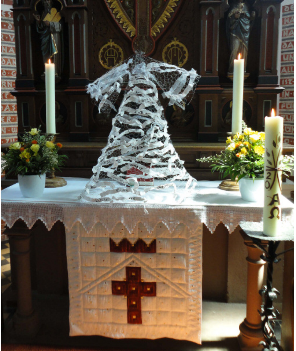
Das Taufkleid, aufgebaut auf dem Altar

LEHRINGEN · STEMMEN · WITTLOHE · OTERSEN · LUDWIGSLUST