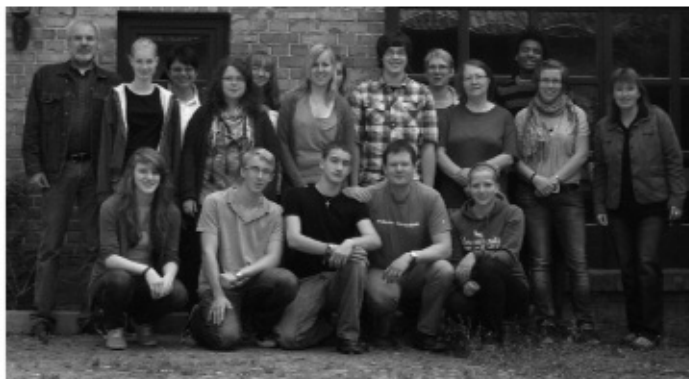
- das Lehringer „Arbeitsteam“ -